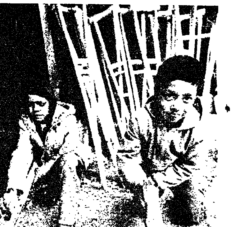
تشهد صناعة العكازات في كابل في الوقت الحاضر رواجاً كبيراً بعد الإصابات التي حلت بالعقول المواطنين خلال الحرب التي دامت قرابة ١٠ سنوات. ويذكر أن حوالي ٣ ملايين لغم مشورة فوق أراضي فلسطين. - كابل - ١ ف ب